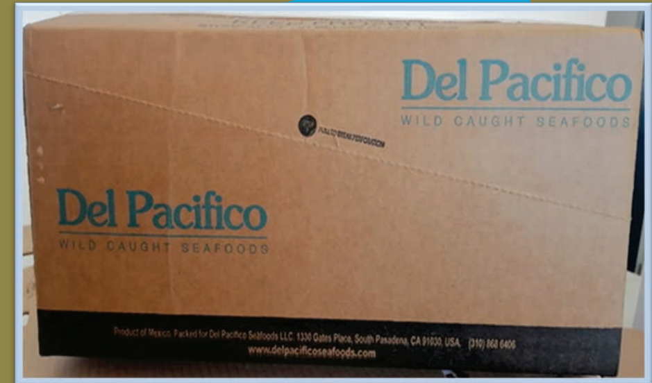
Marqueta de Camarón Frizado 5 Lbs.

Impresión para: Del Pacífico Medidas: La 49.5 cm, An 16 cm, Al 23.5 cm Resistencia: ECT 71 - Flauta BC Aplicaciones: Michellman Interior y Exterior, Parafina. Papel: Grado Acuícola Colores: Azul y Negro 90 Uso: Exportación