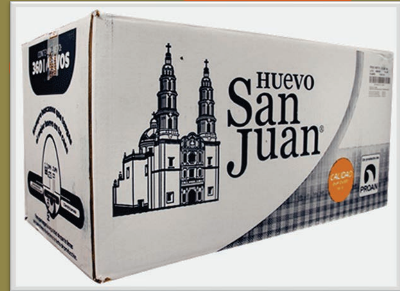
Carteras de Huevo Fresco