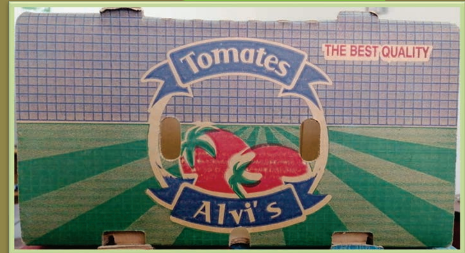
Tomate 13 Kg.