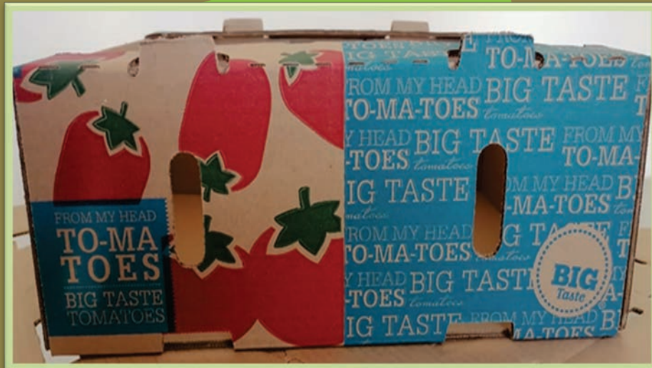
Tomate 25 lbs.

Impresión para: Big Taste Tomatoes (mecanizada)