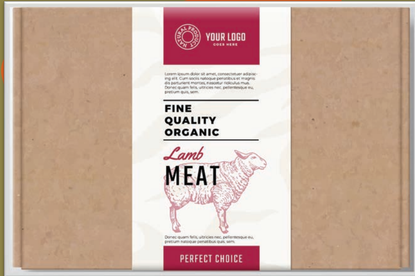
Carne congelada de 25 Kg.