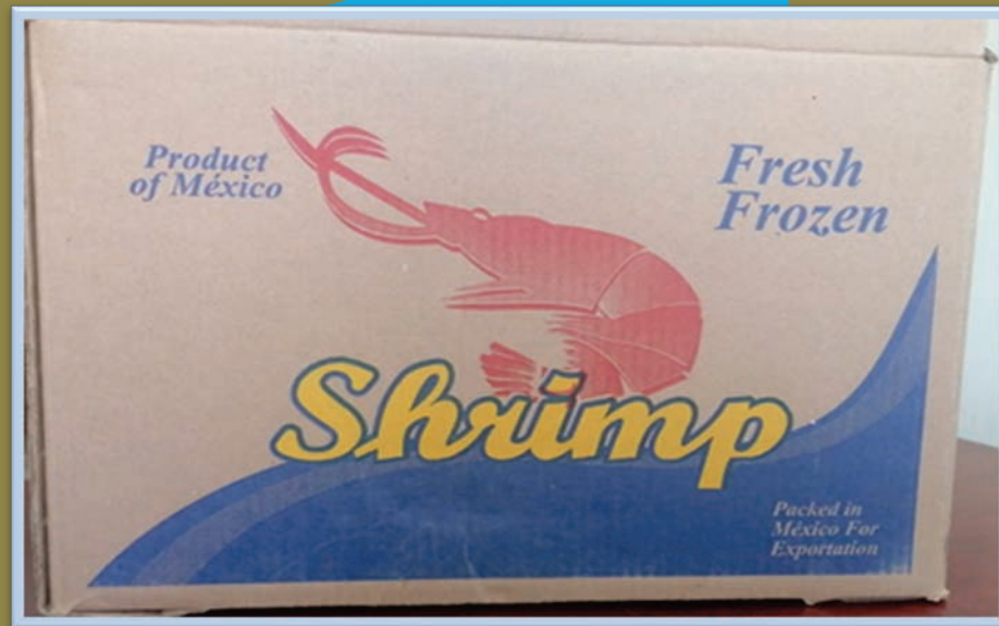
Camarón Frizado de 20 Kgs.