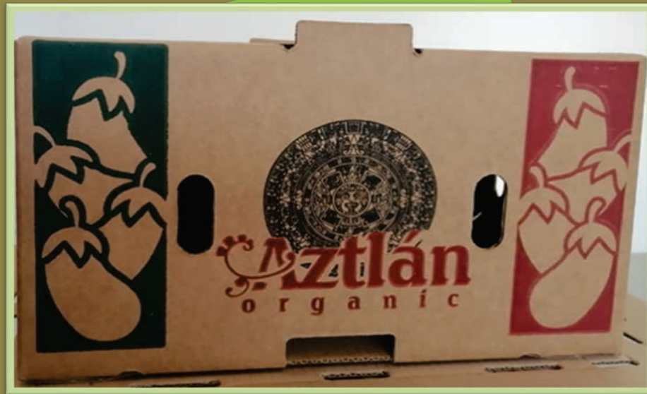
Berenjena 13 kg.

Impresión para: Aztlán Organic (Bridges Organic)