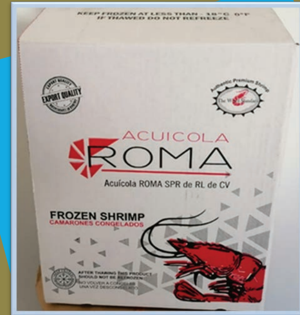
Marqueta 10 Lbs.