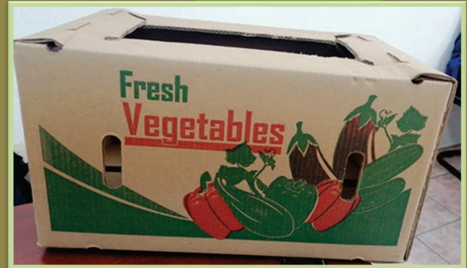
Bell Pepper y Poblano 25 Lbs.